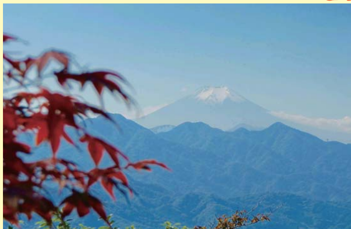
▲要害山からの眺め