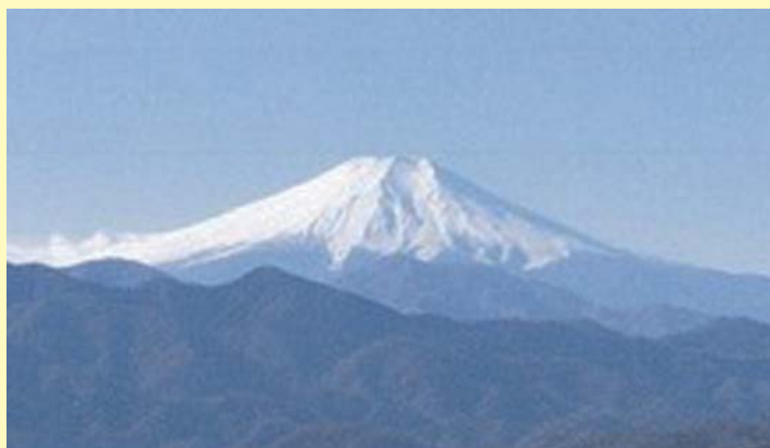
▲要害山からの眺め