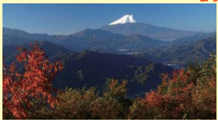
▲百蔵山からの眺め

山頂には桜が植えられ、4月下旬頃が見ごろになる。南方は展望が良く、大月の市街地を見下ろせる。道志山塊の山々、三ツ峠山の峰々にひときわ高くそびえたつ富士山を大月、都留、富士吉田市と続く谷間の向こうに望むことが出来る。