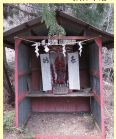
▲金比羅宮不動明王