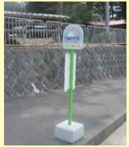
▲石楯尾神社バス停