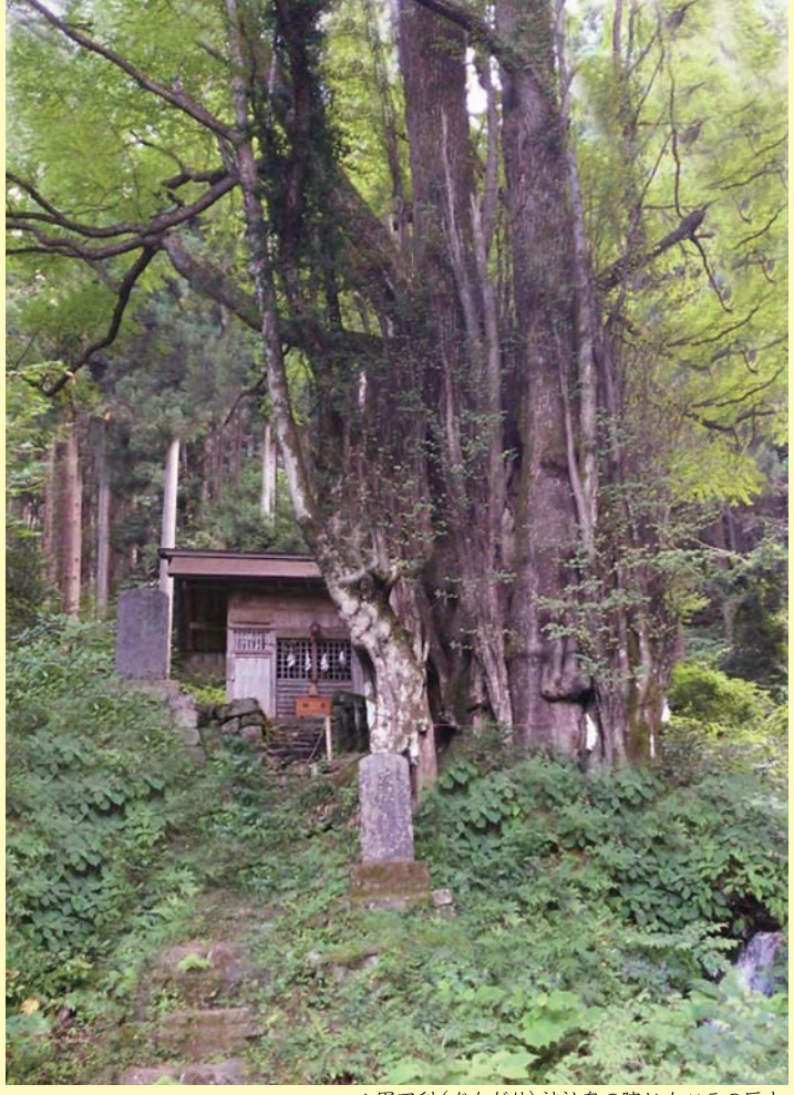
▲軍刀利(ぐんだり)神社奥の院とカツラの巨木