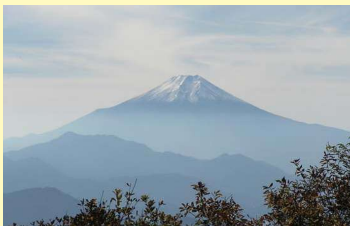
▲権現山からの眺め