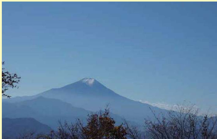
▲権現山からの眺め