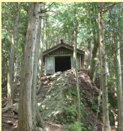
▲大室権現を祀った祠