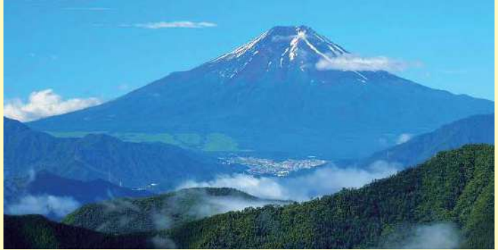
▲奈良倉山からの眺め

ミズナラやクリ、ブナなどの木々が豊富で、特に山頂近くには「巨樹の道」があり数多くのブナの巨木に出会うことができる。少し下山した所に、推定樹齢600年の巨木な栃の木が神秘的な姿を現す。その圧倒的な姿は一見の価値がある。富士山を眺められるポイントも点在している。下山した所に「道の駅こすげ」があり、「イタリアンレストラン」「物産館」も楽しめ、温泉「小菅の湯」では、高アルカリ性の温泉が楽しめる。