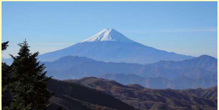
▲牛ノ寝通りからの富士山